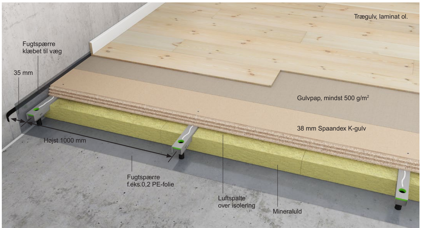
Figur 2 38 mm Spaandex K-gulv på stålstrøer. Strøafstand højest 900 mm, når pladerne stødes over strøer. Strøafstand højest 1000 mm hvor undergulvet er udført med flyvestød (kun til almindelige boligrum – belastning højest 2 kN).

Hvor gulvbelægnings fuldklæbes til en påskruet mellemlade på Klimagulve, skal Klimagulvpladerne være klæbet og skruet til stålstrøerne.